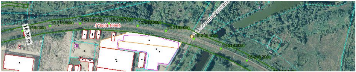
1. objekta sākumpunkts 219,000 km (16,36)