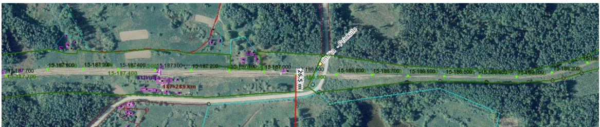
2. objekta sākumpunkts 186,900 km (26,5)