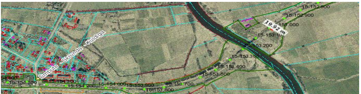
2. objekta beigu punkts 153,000 km (19,92)