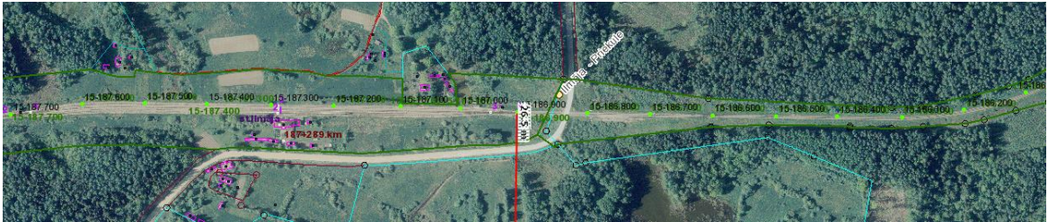
1. objekta beigu punkts 186,900 km (26,5)