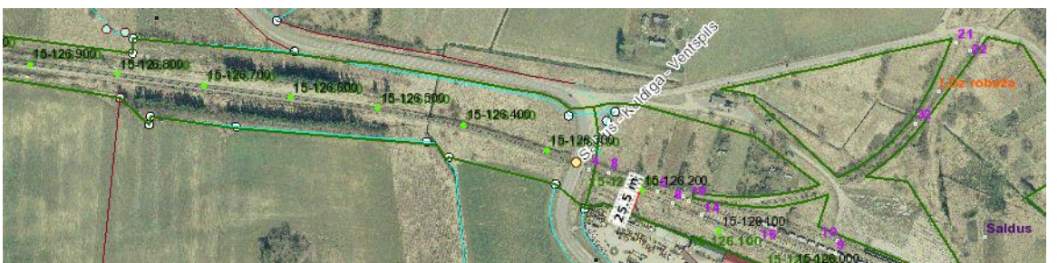
3. objekta beigu punkts 126,200 km (25,5)