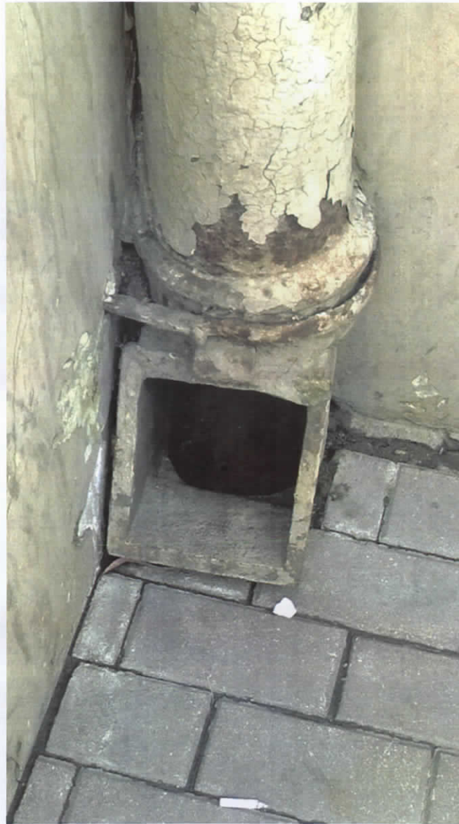
Lietus ūdens noteka Nr.3