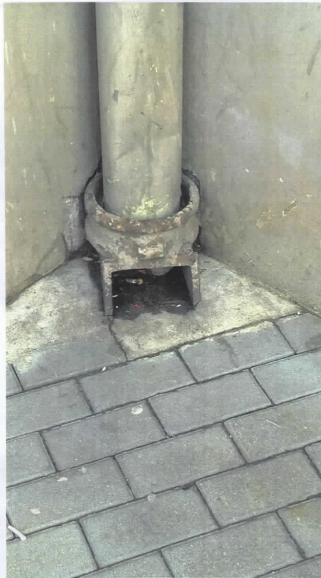
Lietus ūdens noteka Nr.1