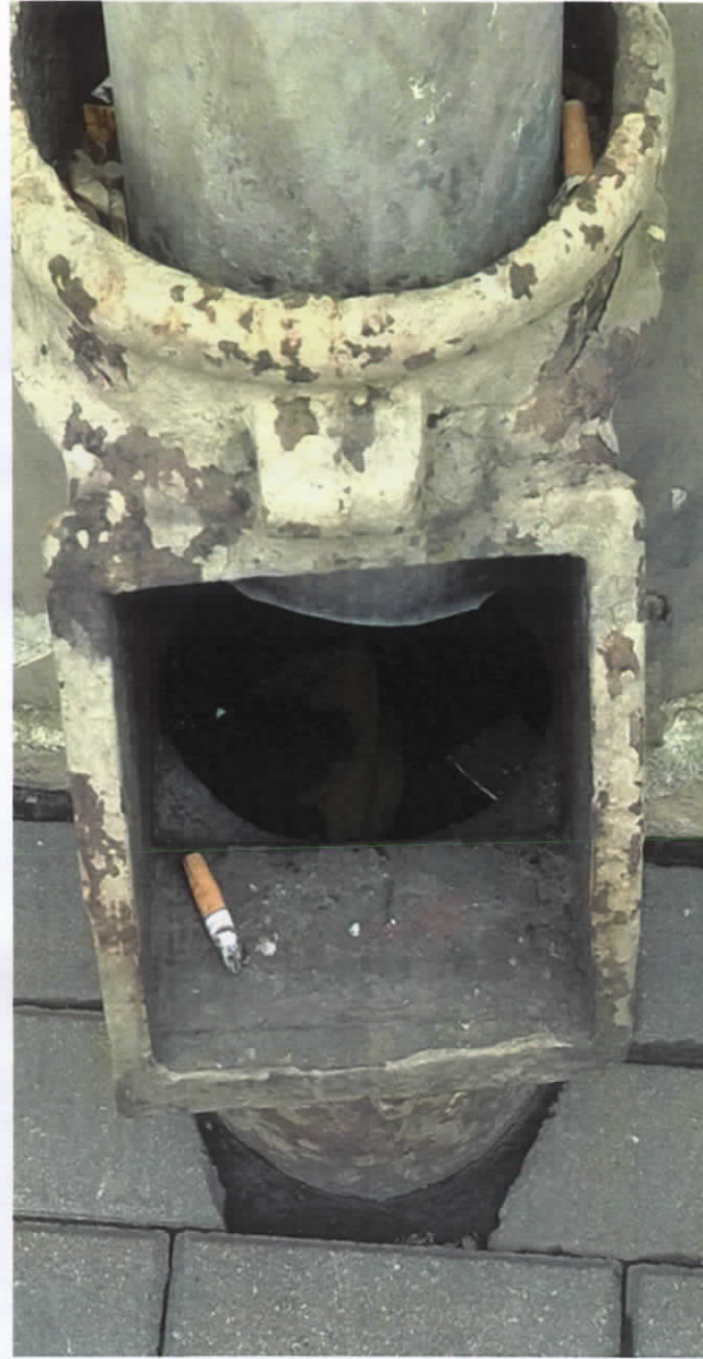
Lietus ūdens noteka Nr.4