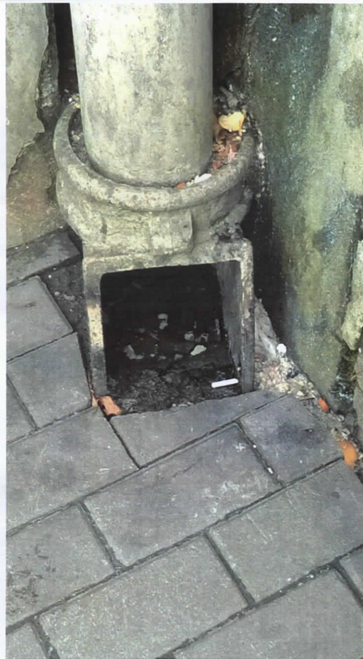
Lietus ūdens noteka Nr.5