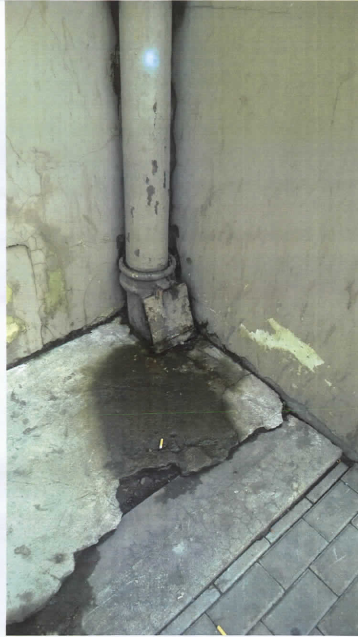
Lietus ūdens noteka Nr.2