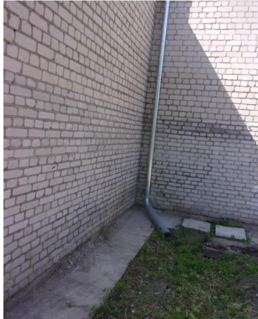
Attēls .Nr.1. Ēkas augstā daļa. Jumta lietusūdens novadīšanas caurule. Pie caurules nepieciešams ierīkot betona tekni

Transformatoru apakšstacijas ēkas Stacijas ielā 90, Ludzā, Ludzas novadā, aktuāla fotofiksācija ar nepabeigtiem darbiem