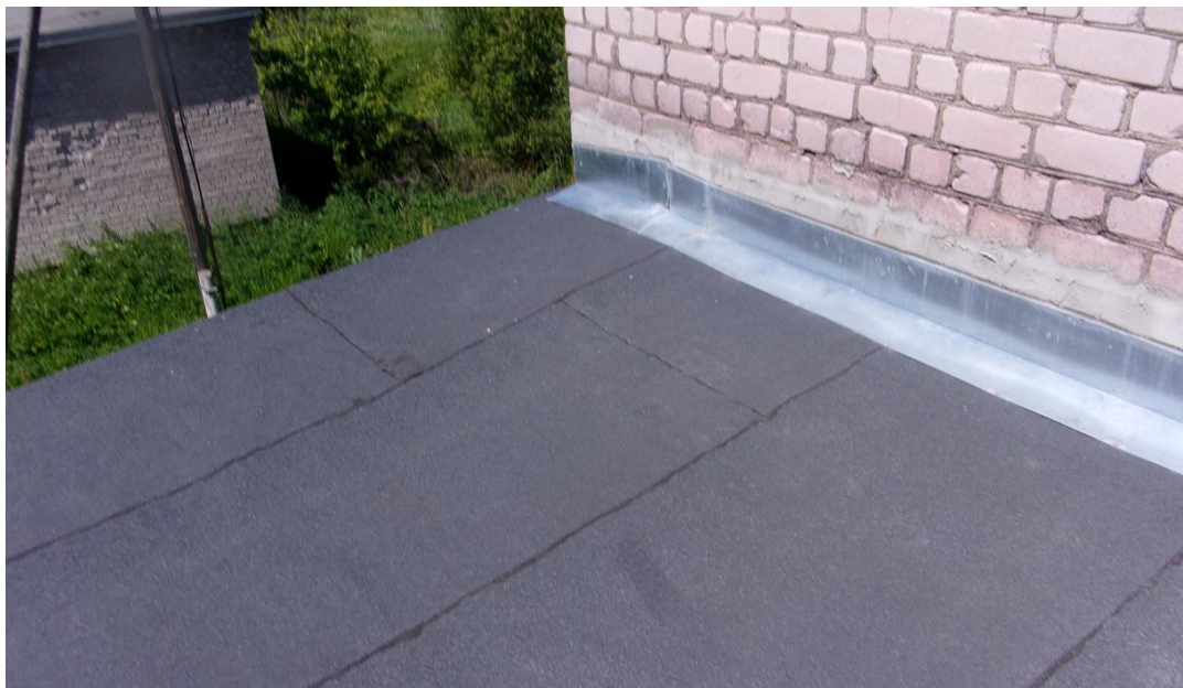
Attēls .Nr.6. Ēkas zemā daļa. Jumta seguma piekļāvuma pie ārsienas (ēkas augstā daļa) pārbūve (skat. Att.Nr.7.)