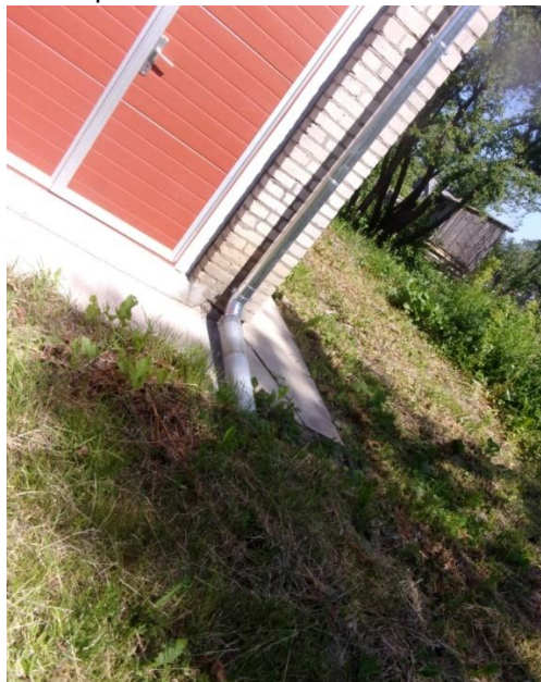
Attēls .Nr.2. Ēkas zemā daļa. Jumta lietusūdens novadīšanas caurule. Pie caurules nepieciešams ierīkot betona tekni