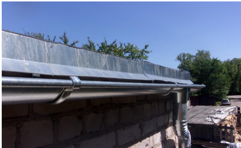
Attēls .Nr.4. Ēkas augstā daļa. Jumta dzega. Nepieciešams veikt piekarteknes stiprinājumu pārbūvi. Nodrošināt piekartekņu stiprināšanu ar minimālo slīpumu >5\text{mm} uz katru piekarteknes t.m. piltuves virzienā. Lāseņa nomaiņu pēc visa garuma. (skat. Att.Nr.5.)