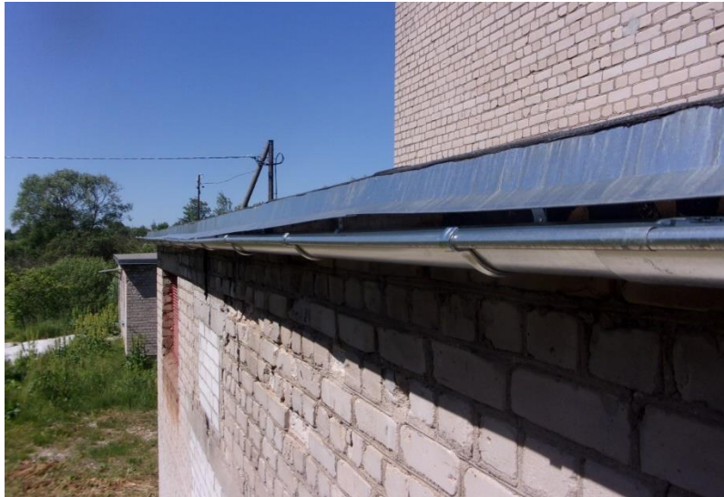
Attēls .Nr.3. Ēkas zemā daļa. Jumta dzega. Nepieciešams veikt piekarteknes stiprinājumu pārbūvi. Nodrošināt piekartekņu stiprināšanu ar minimālo slīpumu >5\text{mm} uz katru piekarteknes t.m. piltuves virzienā. Lāseņa nomaiņu pēc visa garuma. (skat. Att.Nr.5.)